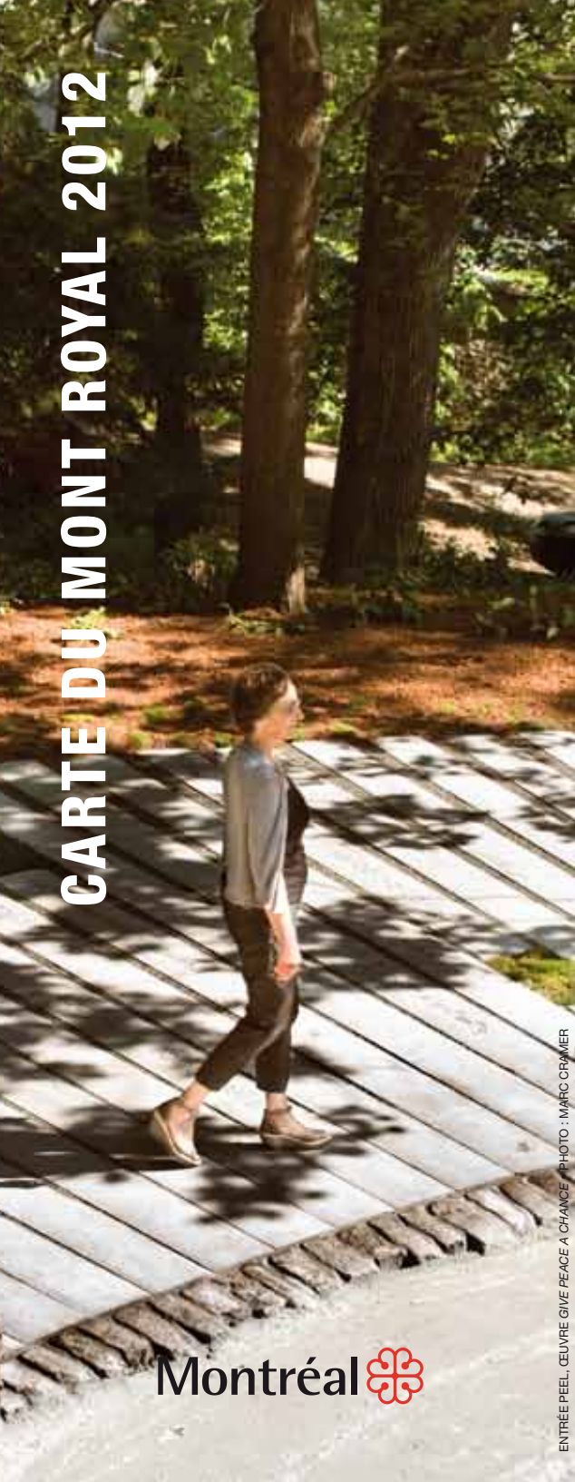
ENTRÉE PEEL, CÉLÉBRE GUYE PEACE ACHANCE